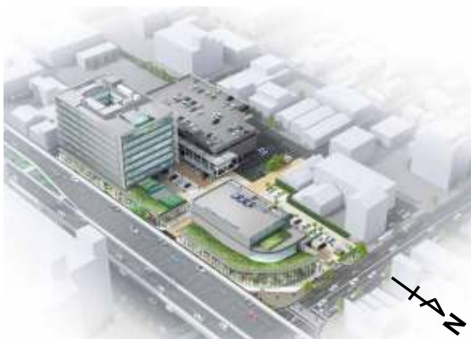
再開発エリア全体の鳥瞰図(イメージ)

※「CASBEE・名古屋」(建築環境総合評価システム)の総合評価Aランク以上の取得を竣工後に予定