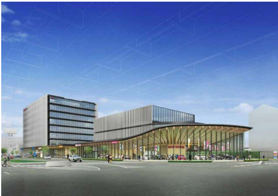
完成予想図(高辻交差点から南西方向のイメージ)

当社は、平成25年2月12日に「本社地区再開発計画」を再開することを発表し、平成25年5月10日および平成25年8月8日の決算発表時に、同日時点までの進捗を報告させていただき現在に至っております。このほど、建物全体の計画がほぼまとまりましたのでお知らせいたします。